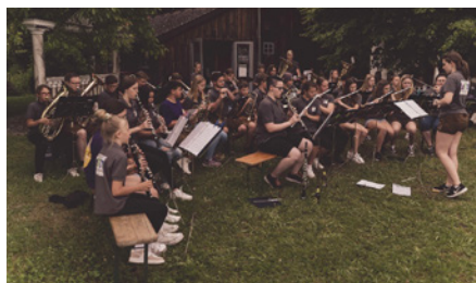
Auftritt beim Klingenden Altheim am Musikfest.

Ein weiteres Highlight war unser Musikfest Altheim, welches von 09.-11. Juni stattgefunden hat. Am 10. Juni konnten wir die bereits einstudierten Stücke beim „Klingenden Altheim“ beim Ochzethaus nochmals präsentieren. Hiermit möchten wir uns nochmals bei allen jungen Helfern:innen und deren Eltern recht herzlich bedanken.