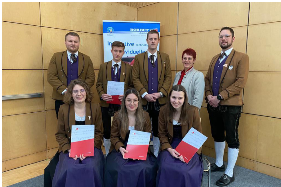
Jungmusikerleistungsabzeichenverleihung in Burgkirchen.