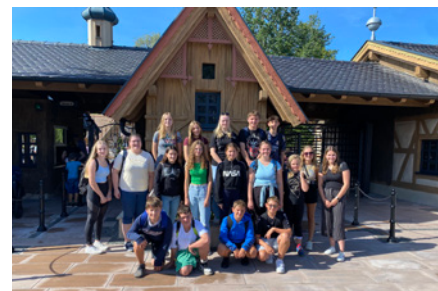
Jungmusikerausflug in den Bayernpark.

Nach unserer Sommerpause starteten wir, am ersten Septemberwochenende, in alter Frische mit der Probensaison für unser jährliches Herbstkonzert. An diesem Wochenende kam der Spaß auch nicht zu kurz. Beim Ausflug in den Bayernpark wurden neue Freundschaften geknüpft und jede Menge gelacht.