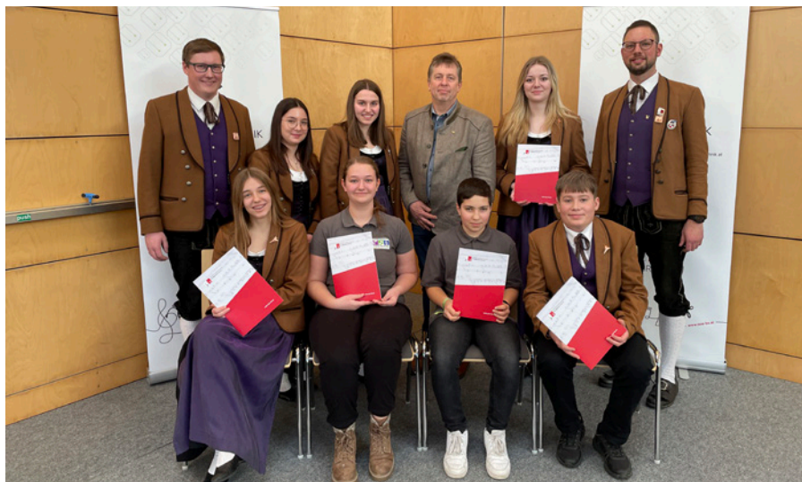
Jungmusikerleistungsabzeichenverleihung in Burgkirchen.

Am ersten Juliwochenende war bei uns einiges los. Am Freitag, den 05. Juli, durften wir unser Programm nochmals beim Seitengassenfest, den „Scharfen Tagen“ in Altheim präsentieren. Am darauffolgenden Samstag führten die Altheimer außerdem nach Neukirchen an der Enknach und gestalteten dort das Jugendmusikfest mit.